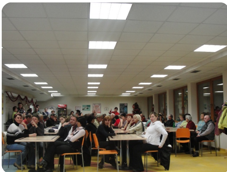
Zasedání zastupitelstva 20.12.2010