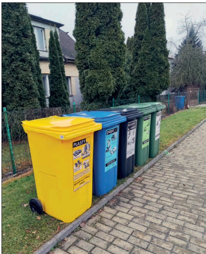
Nádražní ulice II.