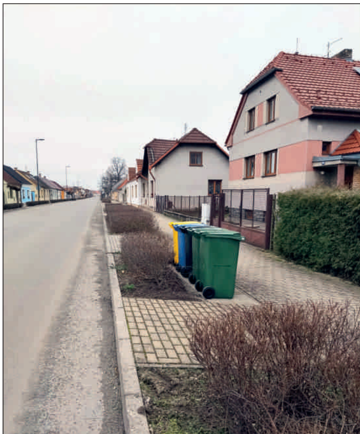
Nádražní ulice I.