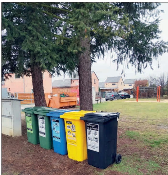
U školky – B. Němcové