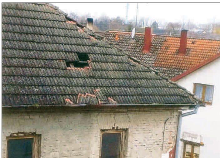
Uvolněné tašky na střeše Rychty