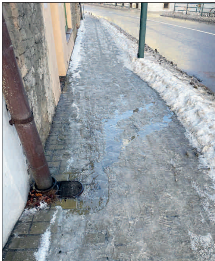
Neodtékající, ucpaný gajgr