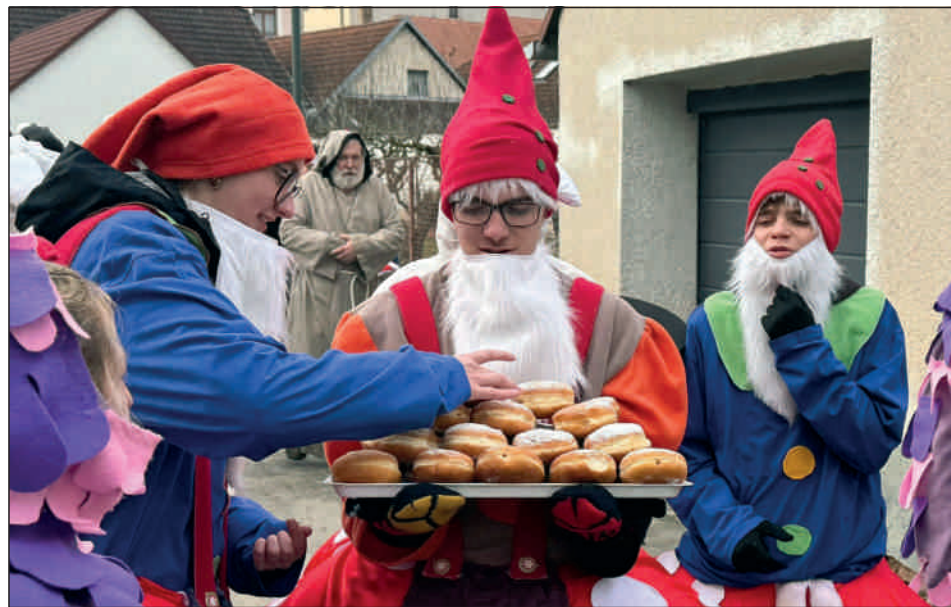
Rodinná pekárna MPM pro nás napekla koblíhy

Hudební doprovod obstarali bratři Kozlíci, kteří nám hráli pěkně do zpěvu i do tance. A protože měli energie na rozdávání, pokračovali ještě na Farské louce, kde masopustní veselí oficiálně končilo formou vepřových hodů, kdy si všichni pochutnali na tradičních zabijačkových dobrotách připravených místním bufetem. V masopustním veselí jsme pokračovali ještě v pátek 13. školním masopustem. Žáky a vyučující z mateřské a základní školy vedl ředitel školy, který si vyžádal svolení u starosty města, jenž školní koledě povolil průchod centrem města a v závěru pozval všechny maškary na tradiční koblíhy a teplý čaj. Hrála muzika, děti tančily a bavily se tak, jak se o Masopustu patří.